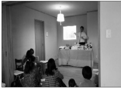
熱心に江端社長の話を聞く参加者