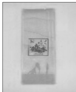
月ヶ瀬健康茶園の有機ほうじ番茶

愛農では現在、豊田市のいしかわ製茶、岐阜県の吉村茶園、奈良県の月ヶ瀬健康茶園の三社のものが定番商品となっています。中でも、冒頭記事で紹介した月ヶ瀬健康茶園のものは、愛農の定番となつてまだ間もない商品です。 一般的に煎茶は80℃前後のお湯で入れるとおいしいといわれていますが、同園の煎茶は熱湯でいれるとよいそうです。時間を掛け