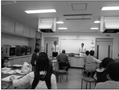
参加者は大人23名、子供10名と大盛況でした。