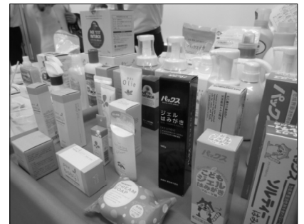
石けんほか、歯磨き粉、化粧品などもある太陽油脂の商品

また、ハンドソープや制汗剤などの有効成分として使われている殺菌剤に、筋力低下の恐れがあることが、米カリフォルニア大の実験でわかったそうです。皮膚から入った